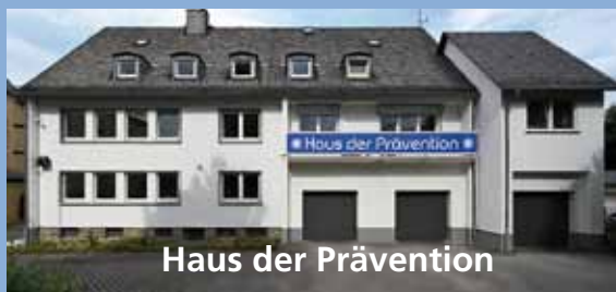
Haus der Prävention

Bankverbindung: Volksbank Mittelhessen IBAN: DE 24 5139 0000 0071 2604 02