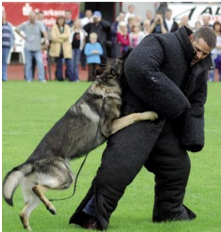
„Scotty“ holte Innenminister Rhein schnell von den Beinen

Einer der vielen optischen Höhepunkte neben Hubschrauberlandung, berittener Polizei, Schwarzpulverschießen oder auch Live-Musik waren die Vorführungen der Hundestaffel. Dabei war auch dem Innenminister eine aktive Statistenrolle in Form eines dick ummantelten „Bösewichtes“ zugewiesen worden, der sich dem Einsatz eines Polizeihundes gegenübersah und diesen nicht auf beiden Beinen durchstand. Die heftige, allerdings durchaus pflichtgemäße Attacke von „Scotty“ holte den obersten Chef auch des Polizeihundes schnell von den Beinen. Der Hundeführer griff umgehend schützend ein und Minister Rhein nahm's natürlich mit dem erforderlichen Humor.