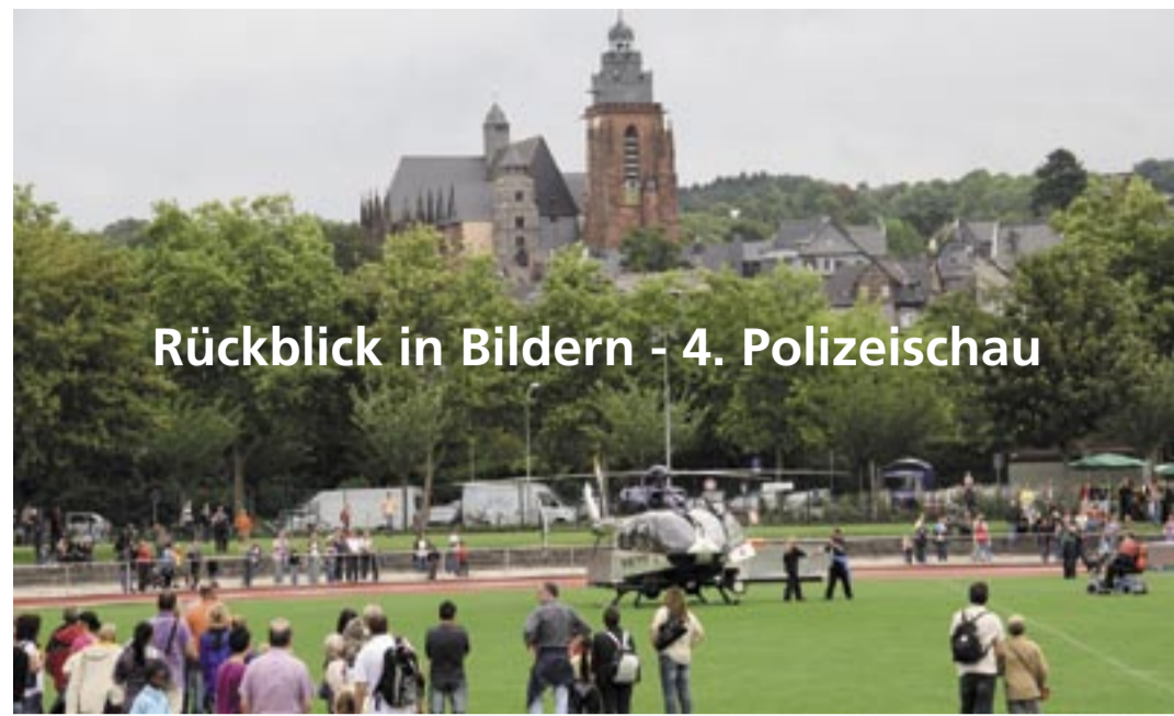
Rückblick in Bildern - 4. Polizeischau

Reader's Digest gibt in der Oktober-Ausgabe sowohl Eltern als auch Lehrern zahlreiche Tipps, wie man Kinder und Jugendliche vor Cybermobbing aus dem Internet schützen kann. So sollten beleidigende Nachrichten, die per SMS aufs Handy kommen, genauso wie Bilder als Beweis unbedingt gesichert werden. Zugleich sollten Cybermobbing-Vorfälle den Betreibern des sozialen Netzwerks gemeldet werden. Wenn die Nachrichten gar Drohungen enthalten oder anonym versandt wurden, raten die Experten, die Polizei einzuschalten.